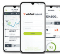
DE MOBIELE WEBFLEET LOGBOOK-APP